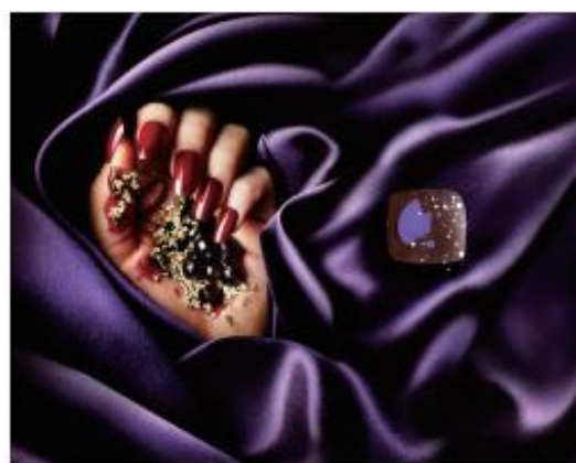
◆エルダーフラワー&カシス