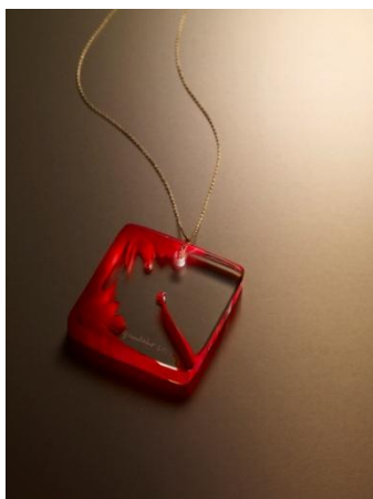
◆ラ・ヴィ・エン・ローズ