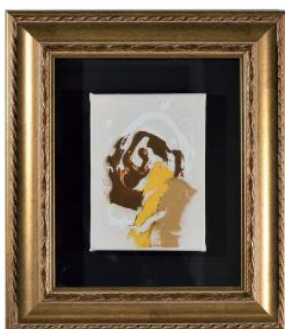
◆絵画 210×150mm 額 435×378mm