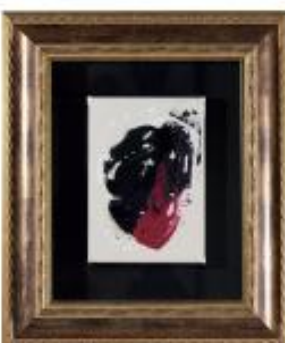
◆絵画 210×150mm 額 435×378mm