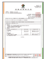
食品衛生試験成績報告書

FFコートは約1~2ミクロンのシリカ薄膜で素材を抗菌・補強!! 公共施設、車両、建物などの木材や石材に使用し、多用途に活躍しています。