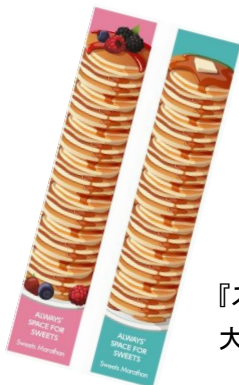
『スイーツマラソン in 愛知』 大会限定オリジナルグッズ