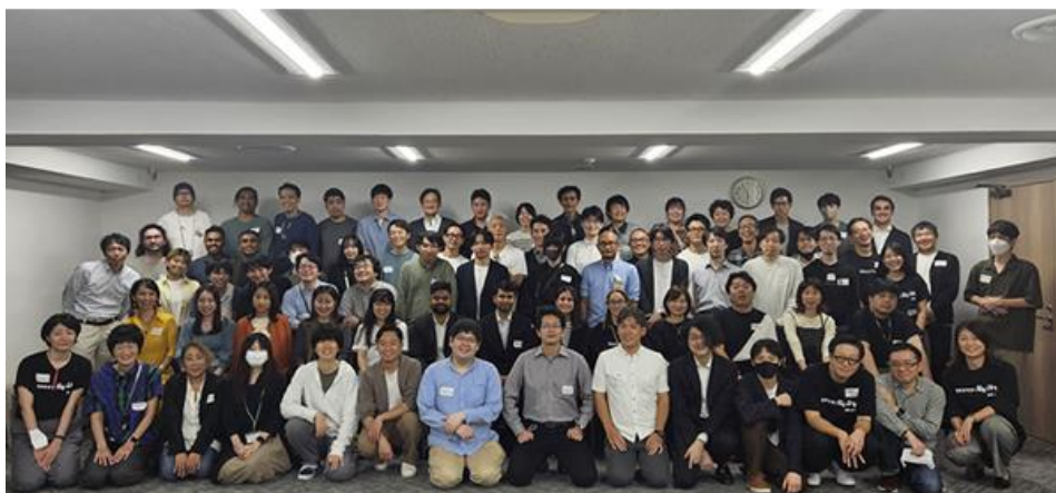
全社参加イベントの様子