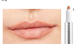
使用商品 a:Wウォーターアイズ カラーインク 10/b:アイブロウジェル/c:カラークレヨン 01(すべて RMK)

ヌーディな色合いながらも明るいトーンのベージュでナチュラルに。唇の質感を引き立たせながら輪郭をしっかりとリ、リップをはっきりさせるのがポイント! リップを塗る前にパウダーをつけるとよりマットな質感に。