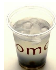
ゆずタピオカドリンク