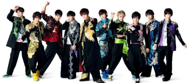
BOYS AND MEN