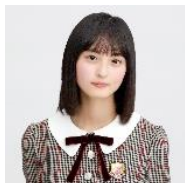
遠藤さくら (乃木坂 46)