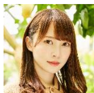
加藤史帆 (日向坂 46)