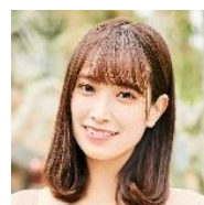
佐々木久美 (日向坂 46)