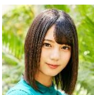
小坂菜緒 (日向坂 46)