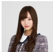
梅澤美波 (乃木坂 46)