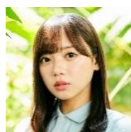
齊藤京子 (日向坂 46)