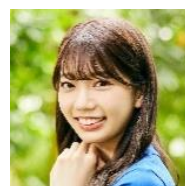
高本彩花 (日向坂 46)