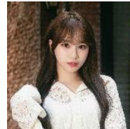
キム・チェウオン (IZ*ONE)