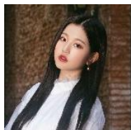
チャン・ウォニョン (IZ*ONE)