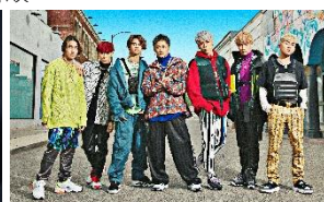
BALLISTIK BOYZ from EXILE TRIBE