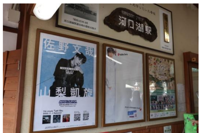
ファン制作による「佐野文哉山梨凱旋プロジェクト」の駅広告