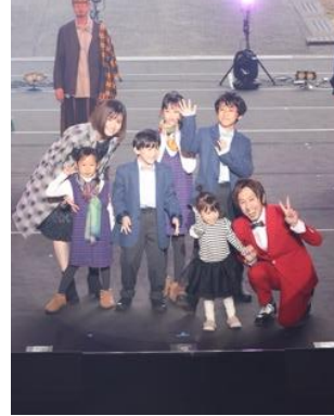
カジサックファミリー