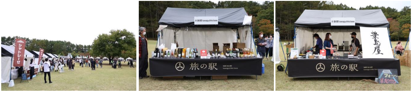
グリーンエリアにて賑う様子

「旅の駅 kawaguchiko base」は、多様な旅人を受け入れ、富士河口湖町の滞在型観光を推進する拠点として2022年6月にオープン。富士河口湖町が持つ観光地ならではの地域課題を見つけ解決し、SDGsの理念の元、持続可能な観光地（地域）づくりを行う基点となる場を創出することを掲げています。グリーンエリアのブースでは、山梨県産ワインの飲み比べや富士北麓フォーといった地産品を販売しました。