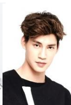
SpeXial (Win, Simon, Wayne, Wes): 台湾