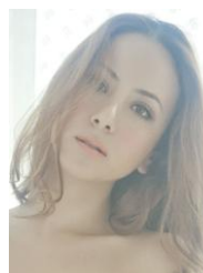
道端アンジェリカ