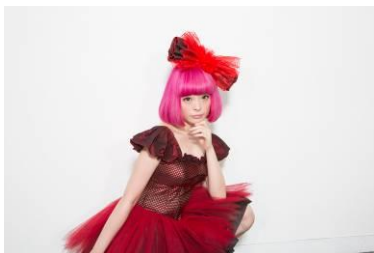
きゃりーぱみゅぱみゅ