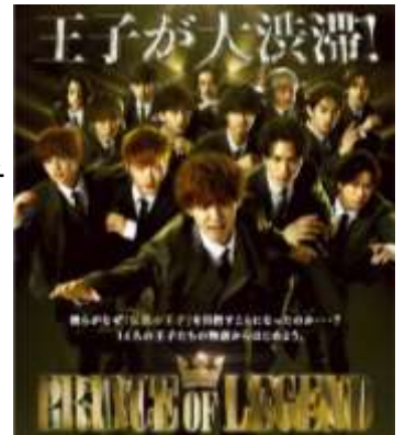
「PRINCE OF LEGEND」 日本テレビ 2018年10月3日(水)放送スタート 毎週水曜深夜 24:59～25:29 (C)「PRINCE OF LEGEND」製作委員会 (C) HI-AX All Rights Reserved.

「セレブ王子」「ヤンキー王子」「生徒会長王子」「ダンス王子」・・・など個性豊かな王子が大渋滞！TGCのステージでも王子が大渋滞するかも！？ぜひ、ご期待ください！