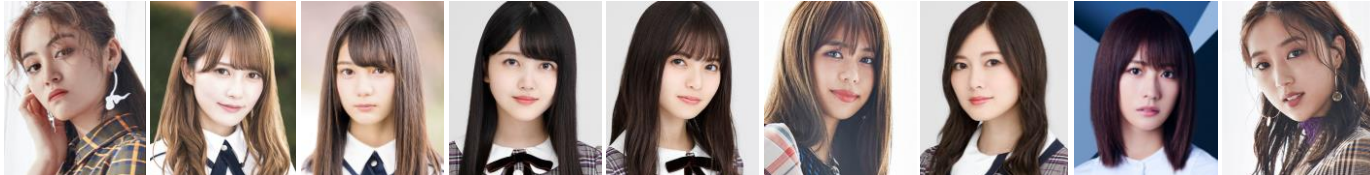
楓 (E-girls/Happiness) 加藤史帆 (けやき坂 46) 小坂奈緒 (けやき坂 46) 久保史緒里 (乃木坂 46) 齋藤飛鳥 (乃木坂 46) 佐藤晴美 (E-girls/Flower) 白石麻衣 (乃木坂 46) 土生瑞穂 (樺坂 46) 坂東希 (E-girls/Flower)