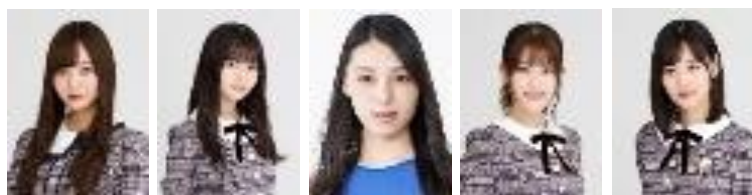
梅澤美波 (乃木坂 46) 齋藤飛鳥 (乃木坂 46) 相楽伊織 松村沙友理 (乃木坂 46) 山下美月 (乃木坂 46)