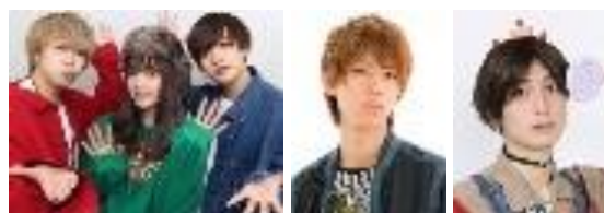
さんこいち はじめしゃちょー 夢屋まさる