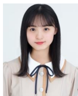
遠藤さくら (乃木坂46)