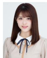
松村沙友理 (乃木坂46)