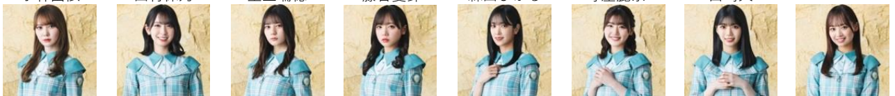
加藤史帆 金村美玖 小坂菜緒 齋藤京子 佐々木久美 佐々木美玲 高本彩花 濱岸ひより