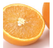
肌のくすみ改善効果のスイートオレンジ