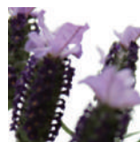
肌にハリを与え、シワ予防・むくみ改善効果のラベンダー