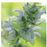
幸せホルモンに働きかけるクラリセージ