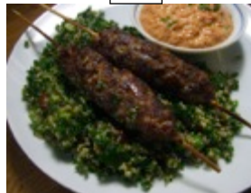
クロケタス・デ・ポジョ