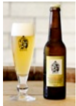
日本クラフトビール