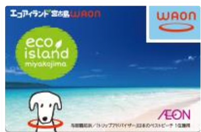
【エコアイランド宮古島WAON】