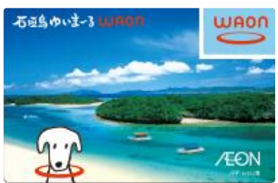
【石垣島ゆいまーるWAON】