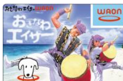
【おきなわエイサーWAON】

首里城の歴史と文化に関する研究や文化遺産の調査、収集、保存や知識の普及啓発にお役立ていただいています。