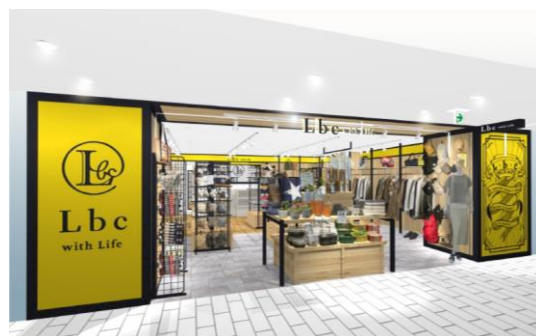
「エミオスタイル店」店頭イメージ

当店は、 新業態 11 店舗目 （オンラインストア含む）の出店です。 業態最小 20 坪のモデル店舗としてオープン します。20 坪の敷地面積を活かし、駅近立地に対応した 高効率な運営を目指 します。そのための 新しい取り組みとして、一部商品のパッケージ化を行ない、高密度陳列・オペレーション効率向上を実現 します。