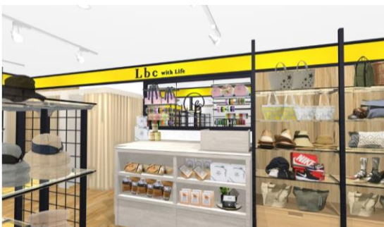
「エミオスタイル店」店内イメージ

また当店は、 ギフト好適品の品揃えを充実 させます。贈り物に人気のフレグランスグッズやバスグッズなどを 店先で展開 することで、 店前を通行される多くのお客さまに訴求 します。また、 パッケージ・箱入り商品を増やす ことでラッピング時間を短縮し、駅に近く、ご利用になる方が多い中でも 気持ちよくお買い物 して頂けます。