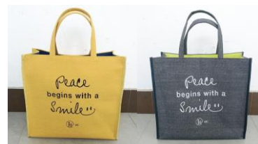
<サイズ：縦 35・横 42・マチ 17>

5,400 円（税込）以上お買上げのお客さま、先着 300 名様にプレゼントします。マチもしっかりとあり、丈夫な素材なのでお買い物バッグとしても、ちょっとしたお出かけにもピッタリです。