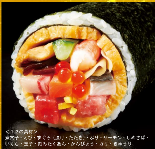
<12の具材> 煮穴子・えび・まぐろ（漬け・たたき）・ぶり・サーモン・しめさば・いくら・玉子・刻みたくあん・かんぴょう・ガリ・きゅうり