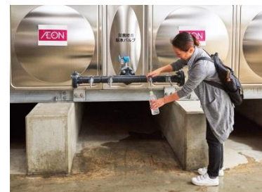
受水槽に緊急用給水口を設置 (写真はイメージです)

また、オープン前には、グループ企業、および行政等と連携した大規模な防災訓練の実施を予定しています。