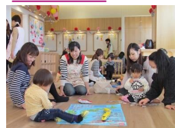
イオンゆめみらい保育園 (イオンモール名取)