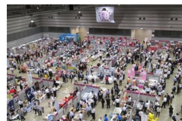
合同見本市 (2017年は約5,000人が来場)

イオングループ各社の従業員が東北地区のお取引先さまの商品への理解を深めるとともに、全国のバイヤーが一同に会して商談を行い、東北産品の販路を全国、さらには世界に広げるための見本市を2012年より毎年開催しています。7回目となる本年の見本市は9月に開催予定です。