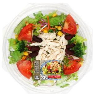
トップバリュ9品目のサラダ冷し中華 胡麻