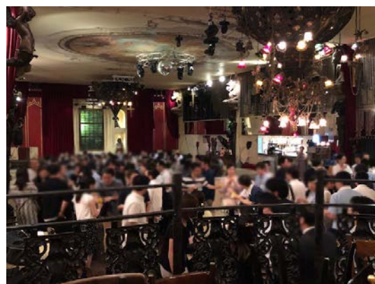
8月に都内で開催したパーティの様子