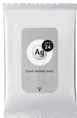
「エージーデオ24」クリアシャワーシート