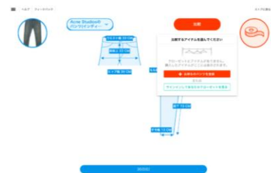
↑オンライン試着室 イメージ