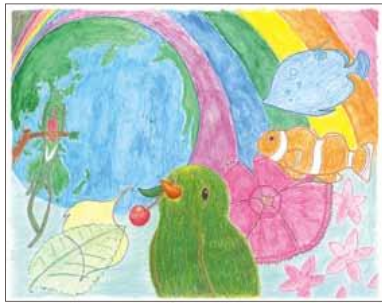
久保 菜生さま (北海道)