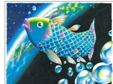
坂本 葵さま (福岡県)