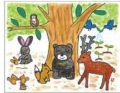
田島 紗羅さま (東京都)