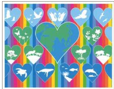
養父 利子さま (東京都)