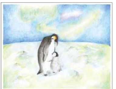
匿名希望さま (大阪府)