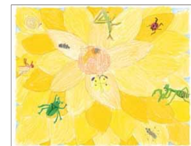
森 優花さま (福岡県)