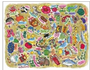
田中 真一さま (神奈川県)