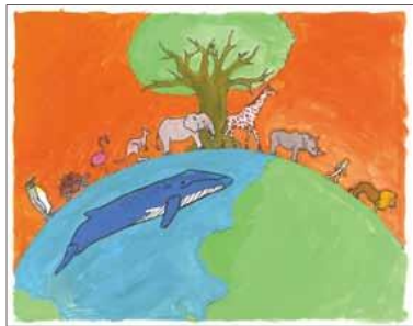
船田 新太さま (東京都)