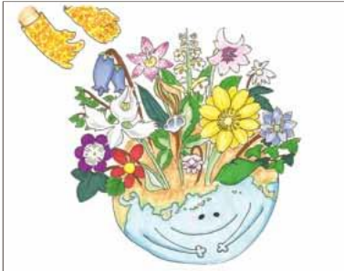
井上 泰一さま (新潟県)