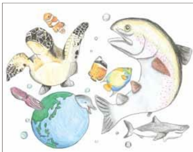
伊東 綾乃さま (三重県)