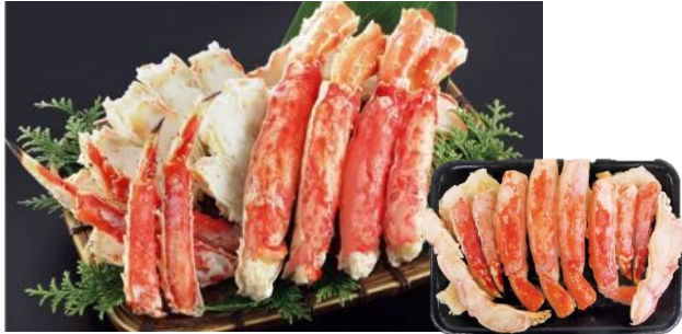
1kg入り 本体価格9,500円+税※5 配送料込み