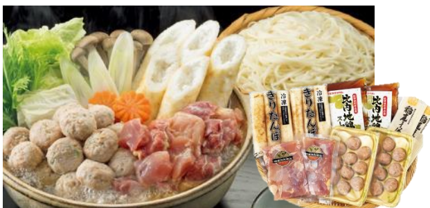
本体価格4,700円+税※5 配送料込み