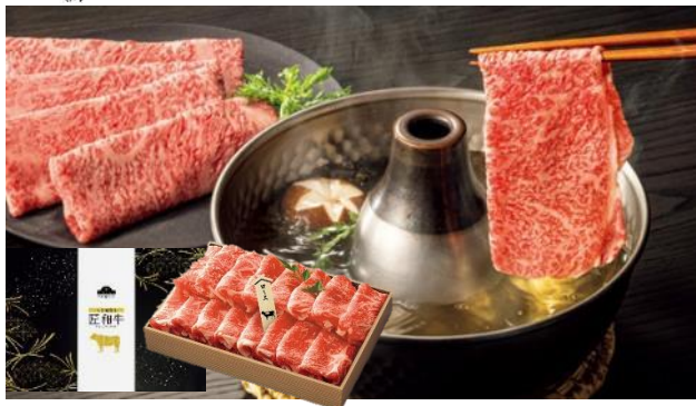
400g入り 本体価格8,800円+税※5 配送料込み