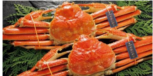
2尾入り(約800g) 本体価格6,500円+税※5 配送料込み

“4等級以上”の黒毛和牛「トップバリュ セレクト 匠和牛」や各地の「銘柄牛」を用意