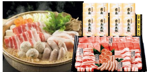
本体価格4,800円+税※5 配送料込み