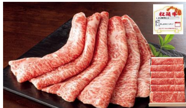
400g入り 本体価格11,000円+税※5 配送料込み