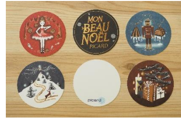
コースターイメージ

ご予約特典：人気イラストレーターの米澤よう子氏が ピカールのために描き下ろした、 オリジナルコースターセットをプレゼント。