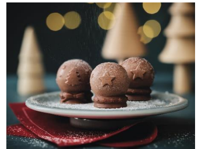
写真左から、チーズフォンデュ サヴォワ風 / クリスマスリース / 小さなスノードーム

イオンサヴール株式会社が展開する、美味しさと品質にこだわる冷凍食品専門店 Picard(ピカール)は、11月24日(火)から12月25日(金)まで“HAPPY NEW CHRISTMAS!”をテーマに、クリスマス限定約40商品の販売を順次開始します。