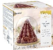
チョコレートの ファビュラーサパン