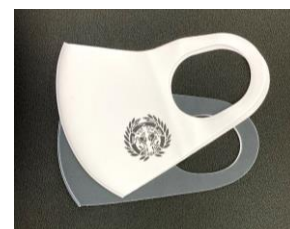
↑「伊達政宗 家紋マスク」