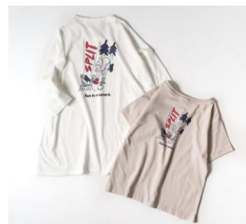
↑ (左) レディス・(右) ガールズ

サイズ：120・130・140・150 カラー：ベージュ 価格：1,990円 (税込 2,189円)