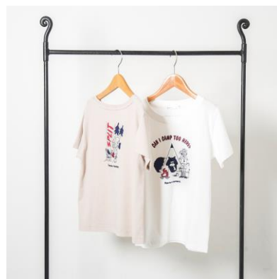
↑ボーイズ (オフホワイト)・ ガールズ (ベージュ)