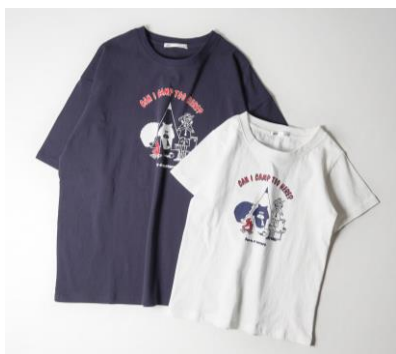
↑ (左) メンズ・(右) ボーイズ