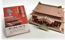
（左から）甦れ！首里城ピンバッジ、一筆箋（16種セット）、甦れ！首里城Tシャツ、美術模型首里城正殿