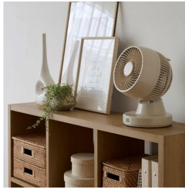
DCサーキュレーター