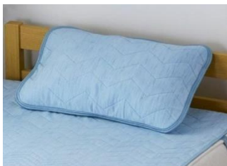
アイスコールド まくらパッド 価格：本体980円 (税込1,078円)