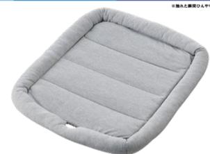
アイスコールド ペットベッド 価格：本体1,980円 (税込2,178円)

<ホームコーディ コールド> https://aeonretail.com/Page/hc-cold.aspx