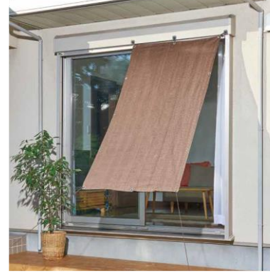
風が通る日よけシェード

昨年は観測史上最も暑い夏になり、今年はさらに猛暑日が増えると予想されるなど、近年全国的に気温が高くなっています。暑さから身を守る必要性が高まる一方、電気代の値上げや、猛暑による電力使用量の上昇から、節電対応商品へのニーズも年々高まっています。