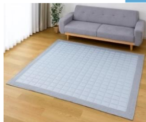
アイスコールド 洗えるキルトラグ (185×185cm) 価格：本体5,980円 (税込6,578円)