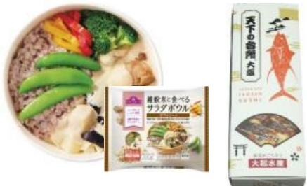
トップパリュ 雑穀米と食べる サラダボウル

忙しい時こそ好きな時にいつでも満足できるワンディッシュ（ワンプレート）で主菜と副菜がセットになったものから、健康に配慮したサラダボウルやガッツリ食べられるものまで豊富なバリエーションで品揃えいたします。また、京都祇園で、2004年からフレンチレストランを営むシェフが考案した「クラフトスープ」を展開いたします。自然素材を使い、手作りした美味しさと健康のバランスを追求したスープです。さらにアイスでは、「大山 白バラ 牛乳ソフト」「北海道メロンソフト」など全国各地のアイスクリームも取り揃えます。