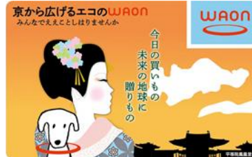
【京から広げるエコのWAON】 京都府の環境保全対策に役立てられます。