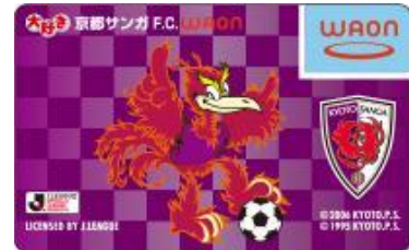
【大好き京都サンガF.C. WAON】 クラブのホームタウン活動に役立てられます。