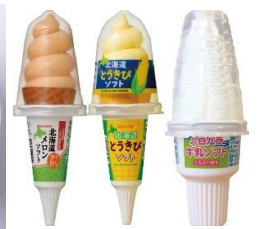
ご当地アイス各種