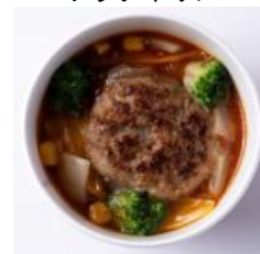
CHANTMEAL 5種野菜とハンバーグの トマトシチュー