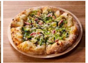
京都産九条ネギと大阪湾産 しらすのピッツァ