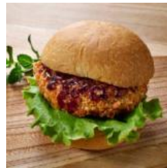
九条ネギ入り メンチカツのバーガー

さらに、伏見は古くから酒蔵のまちとして知られ、伏見酒造組合に所属する16蔵元からは100種類以上のお酒を取り揃えます。東山酒造からは、「米」と「造り」へのこだわりを最優先に醸したお酒“ かんぬき 門 純米吟醸”を提供いたします。他にも“京都の珈琲職人”としての誇りをもち世界に通じる“本物”の味わいをたえず追求し続ける「小川珈琲」や、かつお風味たっぷりの濃厚つゆ「創味のつゆ」など京都を代表する品々を取り揃えました。