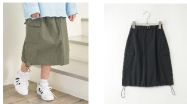
〈オリーブ〉 〈ネイビーブルー〉