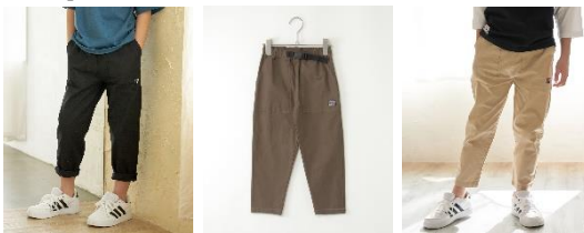
〈ブラック〉 〈オリーブ〉 〈ベージュ〉