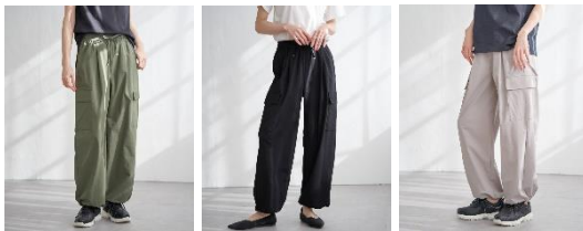
〈オリーブ〉 〈ネイビーブルー〉 〈グレージュ〉