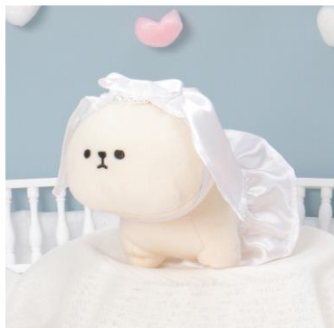
〈ウェディングドレス〉