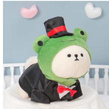
〈カエルタキシード〉