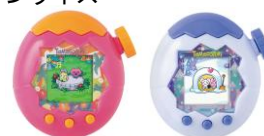
Tamagotchi Paradise ©BANDAI

たまごっちパラダイスを取り揃え、育成やフィールドの広がり、通信による遊びなど、多彩な楽しみ方ができる最新シリーズをご提案します。