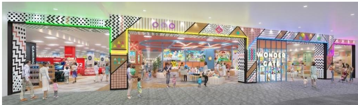
「イオンスタイルつくば」3階フロアのイメージ

イオンリテールは7月17日（金）、「イオンつくば店」（茨城県つくば市）をリニューアルし、「イオンスタイルつくば」に改称します。