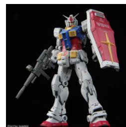
RG 1/144 RX-78-2 ガンダム Ver. 2.0 ©創通・サンライズ

組み立て体験による“作る楽しさ”と、コレクション性による“飾る楽しさ”の両方を実現。コレクター心をくすぐる豊富なラインナップを展開します。