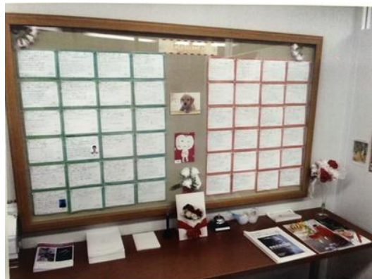
出会うための掲示板「PRボード」