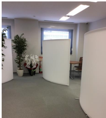
白を基調とした清潔感のある店舗