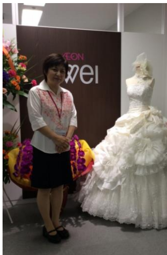
「ツヴァイ那覇」入口 MCの制服は“かりゆし”