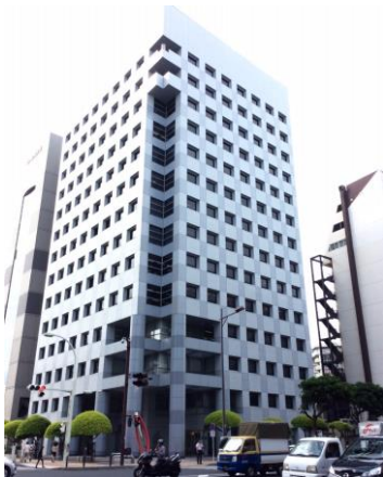
「ツヴァイ那覇」が入居する “ニッセイ那覇センタービル”