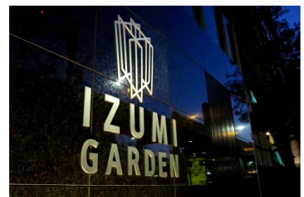
泉ガーデンギャラリー（六本木）

開催日時：2016年7月15日（金） 18：30～21：00（受付17：30～） 開催場所：泉ガーデンギャラリー （東京都港区六本木1-5-2） 対象：女性 25歳～40代くらいまでの独身の方 料 金：一般の方→5,500円 クラブチャティオ会員（登録無料）→5,000円 お友達割チケット（2枚）→10,000円 定 員：500名 服 装：パステルカラーを取り入れた服装でお越し下さい！ 詳細、申込み： https://www.clubchat.io.jp/cam/girlsummerparty/