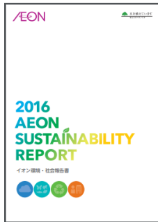
(掲載ページの一例)

専門家の方々向けに、KPIの進捗をはじめとした詳細な活動内容やパフォーマンスデータを、体系的・網羅的に紹介。