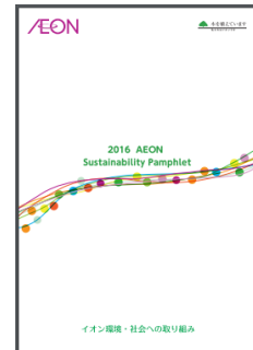
(掲載ページの一例)

一般のお客さま向けに、イオンの特徴的な取り組みを中心に、ビジュアルを工夫して分かりやすく紹介。