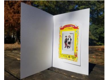
▲記念台紙イメージ

またオープニング期間には、お子さま連れのお客さまへの特典として、商品を 1 点以上お買い上げの方に「ガラポンゲーム」もご用意し、先着 400 名の親子連れやご家族でお越しのお客さまにお楽しみ頂けます。