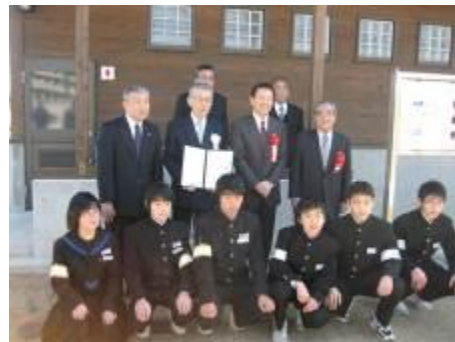
2010年太陽光発電システムの寄贈 (千葉県鴨川市立鴨川中学校)