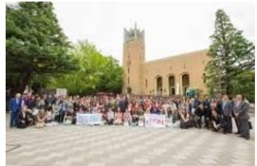
第6回ASEP開講式(早稲田大学大隈講堂)

2017年度は、「生物多様性と再生」をテーマに、王立プノンペン大学(カンボジア)、清華大学(中国)、インドネシア大学(インドネシア)、早稲田大学(日本)、高麗大学校(韓国)、マラヤ大学(マレーシア)、ベトナム国家大学ハノイ校(ベトナム)、チェラロンコン大学(タイ)の8ヶ国合計64名の学生が参加し、8月1日～6日の期間、日本で開催しました。