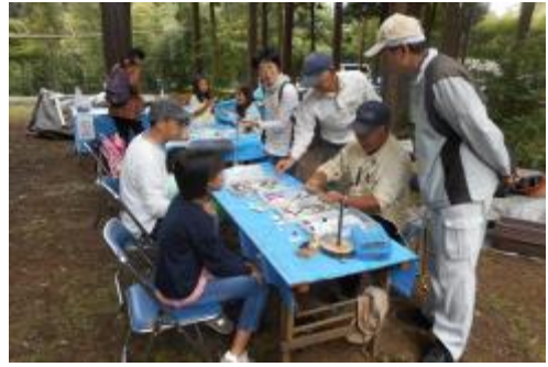
NPO法人しろい環境塾 Dongguri 工作 (千葉)

1991年より26年間「生物多様性の保全と持続可能な利用」のため、国内外の地域において、積極的に環境保全活動を継続している団体への助成支援を行っています。2016年度は、植樹、森林整備、砂漠化防止、里地・里山・里海の保全、湖沼・河川の浄化、野生生物の保護、絶滅危惧生物の保護などを行う団体99件に、9,797万円の助成を行いました。累計では2,744件、総額24億9,700万円となりました。2017年も継続して環境活動への助成を実施します。