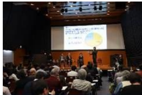
第1回イオン未来の地球フォーラム(東京大学)

地球の環境変化や環境問題について、参加者とともに解決方法を考え、実行案を議論し、講演と対話型パネルディスカッションにおいて理解を深め、成果をまとめる「イオン未来の地球フォーラム」を本年から開催しています。2018年1月20日（土）には、東京大学安田講堂にて、「第2回イオン未来の地球フォーラム」の実施を予定しています。