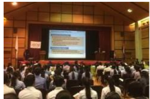
第2回生物多様性を越えて (カンボジア王立プノンペン大学)

国際的な視野で生物多様性の価値を問い直し、新たな価値共有ができる教育を行うことを目的とするプログラムです。2016年10月6日～10月7日ベトナム国家大学ハノイ校で初めて開催しました。本年10月13日(金)に、王立プノンペン大学(カンボジア)にて開催しました。