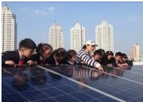
2017年太陽光発電システムの寄贈(中国・武漢)

再生可能エネルギー活用の啓発・普及および環境教育を目的に、国内外の小中学校へ「太陽光発電システムの寄贈」を2009年から行っています。2016年度までに、日本、マレーシア、ベトナム、中国の合計40校に寄贈しました。2017年度は昨年に引き続き、中国武漢市の小中学校5校を対象に寄贈しました。