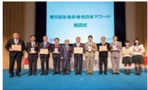
第5回「生物多様性日本アワード」授賞式(国連大学)

生物多様性の保全と持続可能な利用の推進を目的として、「生物多様性みどり賞 (国際賞)」と「生物多様性日本アワード (国内賞)」の2つのアワードを創設し、隔年で顕著な環境保全活動が認められる個人・団体を顕彰しています。2016年度は第4回「生物多様性みどり賞 (国際賞)」を実施し、2017年度は第5回「生物多様性日本アワード (国内賞)」を実施しました。