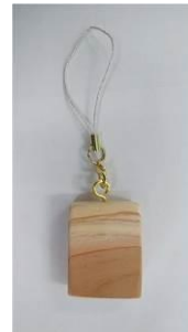
「森のかけらストラップ」イメージ

ワークショップでは、各エコパークを代表する木々の間伐材を利用した「森のかけらストラップ」づくりを実施します。