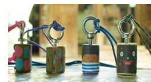
「バードコール」イメージ