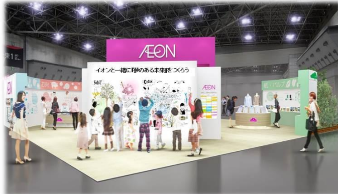
イオンブース イメージ

イオンは2002年より毎年出展しており、今回で16回目となります。本年は、「毎日のお買物で、イオンと一緒に『夢のある未来』をつくろう！」をテーマに、「海」「大地」「森」の3つのコーナーを設け、それぞれの恵みを守り、育てること、そして適切な管理のもとで商品化されたものをご購入いただくことが持続可能な社会の実現につながることをパネルや実際の商品展示、ブース内のツアー等を通じて紹介します。