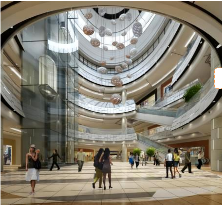
海の波をイメージした 中庭「ウェルカムコート」

当モール周辺は、整備された美しい海岸や公園が点在し、夏季には多くの観光客が訪れるリゾートエリアです。当モールは、地域性を活かし、「あたらしい海岸線」をキーワードに設計しました。館内では「砂浜」「港湾」「波」「岩石」など、海岸からイメージされるモチーフを建築要素に取り入れ、組み合わせることで、お客さまに「煙台」を感じていただきつつも、非日常的で楽しめる空間をご提供します。