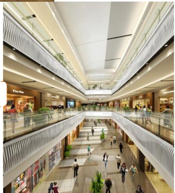
海岸線をイメージした 「メインモール中庭」