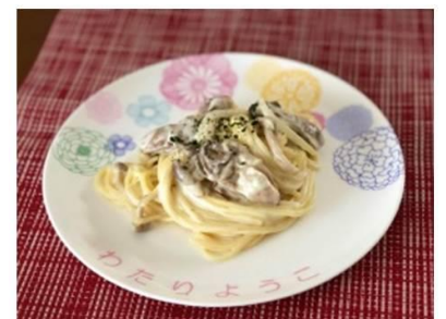
牡蠣のレモンクリームパスタ