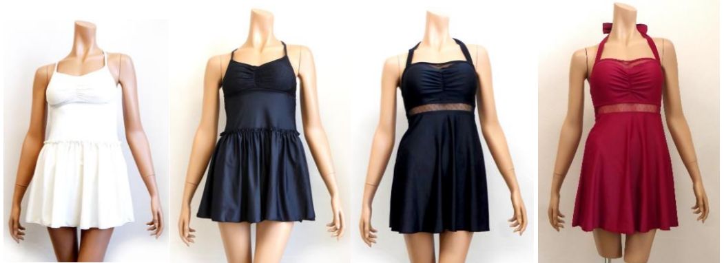
無地レース切替フリルワンピース