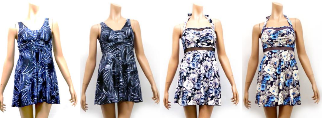
単色花柄ホルターワンピース