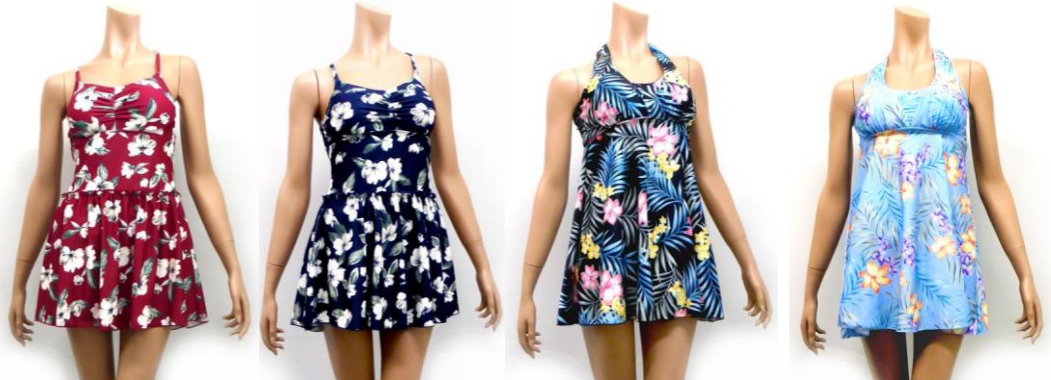
単色花柄切替フリルワンピース