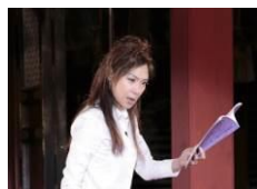
イオン ふるさと発見伝