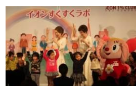
イオン すくすくラボ

* 活動の詳しい内容はこちら ( https://www.aeon.info/1p/ ) をご覧ください。