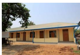
ミャンマー新校舎