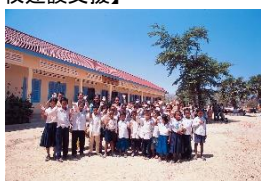
新校舎と子どもたち(カンボジア)