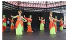
インドネシアで伝統舞踊体験