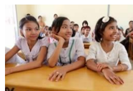
新校舎で学ぶ子どもたち(ミャンマー)