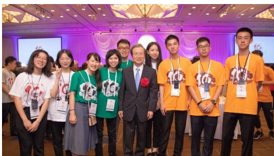
程特命全権大使（当時）と歴代アンバサダー