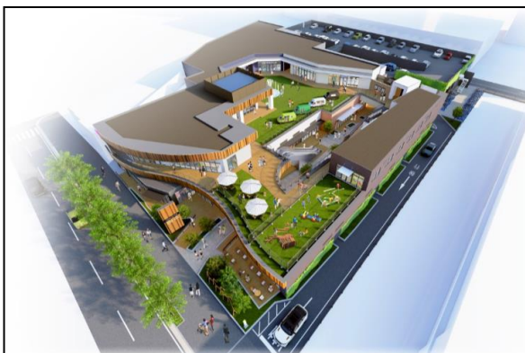
イオンスタイル海老江 2020/3/28 開店

イオンは、脱炭素社会の実現に向け、今後もグループをあげて再生可能エネルギーの活用をはじめとする様々な取り組みを推進してまいります。