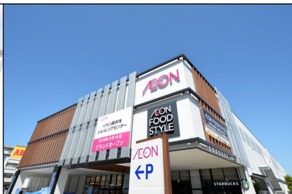
イオン藤井寺SC 2019/9/14 開店