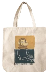
商品名：うつき アーティスト：アベミキ 価格：¥3,000+税

プロジェクト特設ページ： https://store.cox-online.jp/shop/e/ecox-majp/