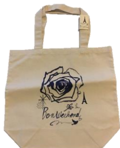
商品名：ボンウィークエンドキャンバスバッグ アーティスト：まゆみん 価格：¥2,800+税