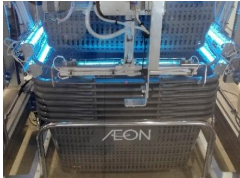
先行導入する「ジョキンザウルス」の紫外線照射イメージ