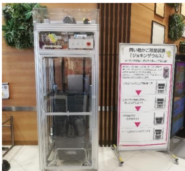
「イオンスタイル京都桂川」設置イメージ

イオンリテールは11月30日より順次、買い物かご除菌装置「ジョキンザウルス」を「イオン」「イオンスタイル」12店舗に先行導入します。「ジョキンザウルス」は株式会社ニューネクスト（京都市南区）と共同で企画・開発し、1号機は「イオンスタイル京都桂川」に設置されています。今回の先行導入を経て今後、さらなる拡大を目指します。