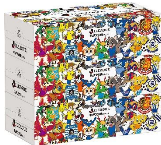
Jリーグキッチンタオルボックス